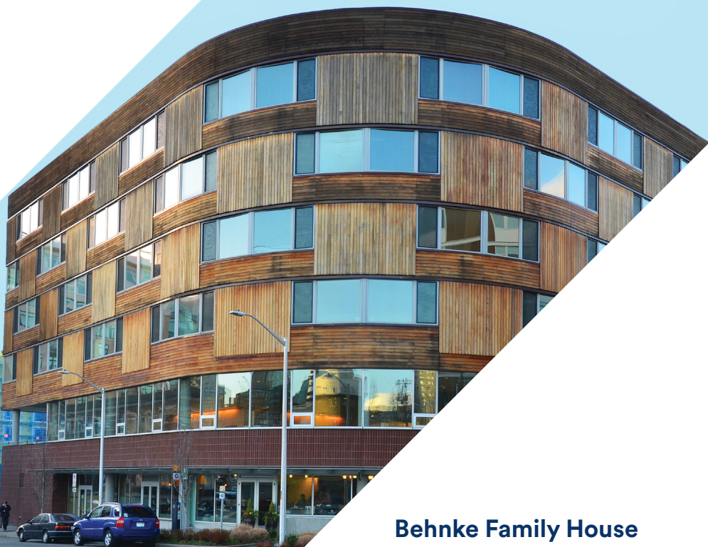
Behnke Family House